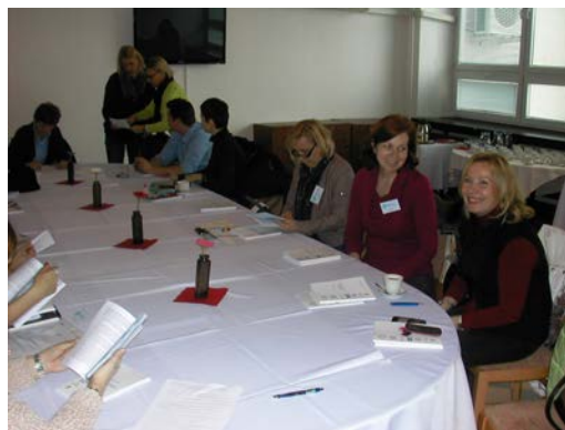
Učiteľky a učelia listujú v nových publikáciách, Slovníku ľudských práv a Vybraných textoch k ľudským právam.