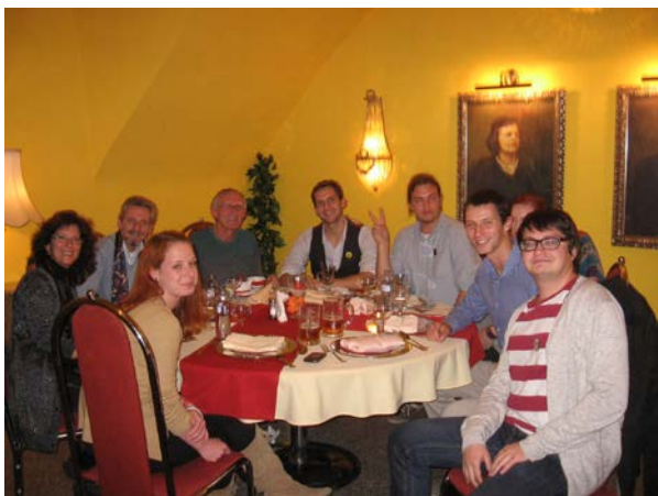
Stretnutie lektorského tímu a Alumni OLP v Banskej Bystrici. Plánovanie spolupráce v XVI. ročníku OLP.

spoločnému trérovaniu kritického prístupu a kladeniu otázok ale aj väčšiemu zapojeniu sa všetkých do uplatnenia ľudských práv v živote škôl.