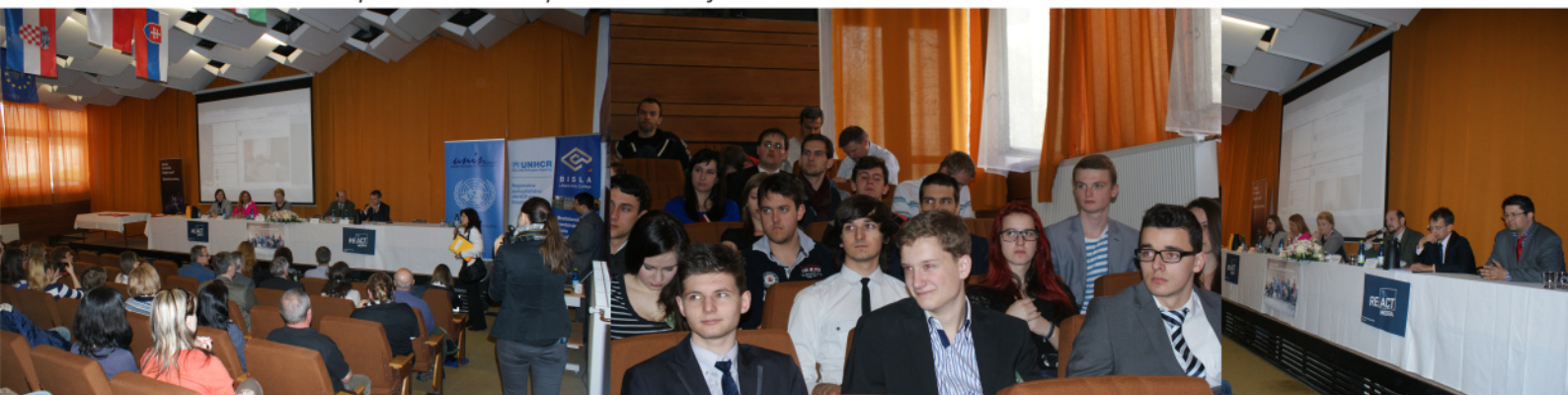
Diskusia s poslankyňami a poslancom Európskeho parlamentu