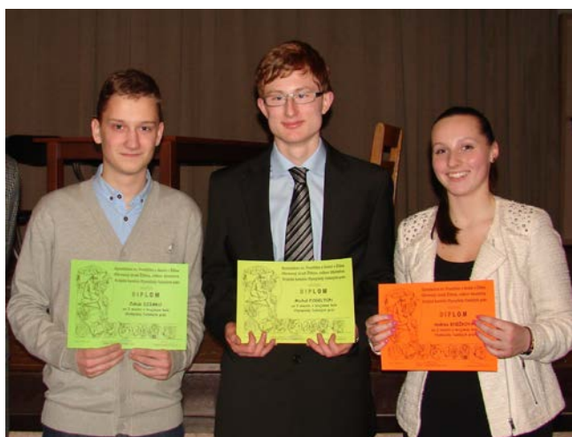
Vítazka a víťazi krajského kola v Žilinskom kraji