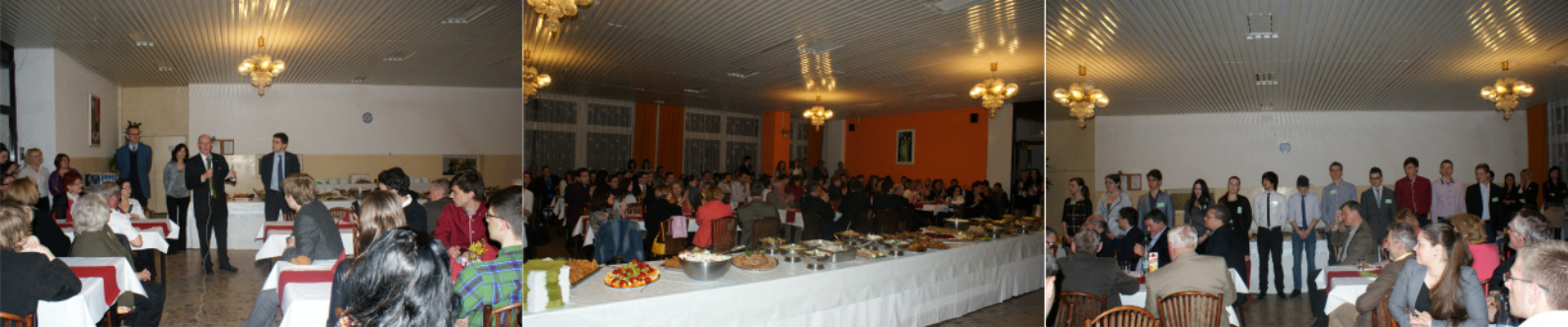
Slávnostný večer za prítomnosti veľvyslanca Spojených štátov amerických Theodore Sedgwicka