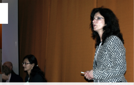
Slávnostné otvorenie XVI. ročníka OLP