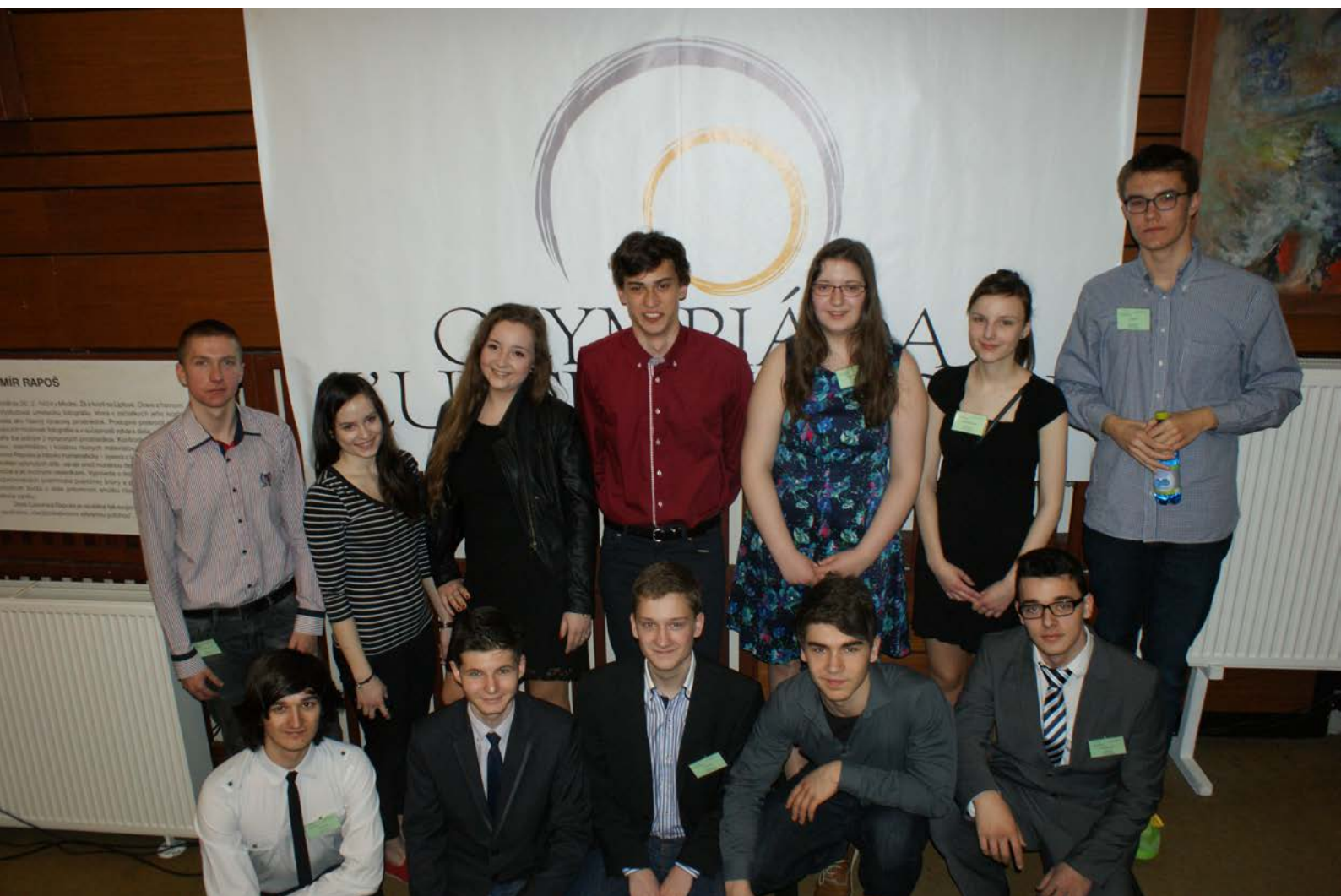
Dvanásť finalistiek a finalistov celoštátneho kola OĽP.