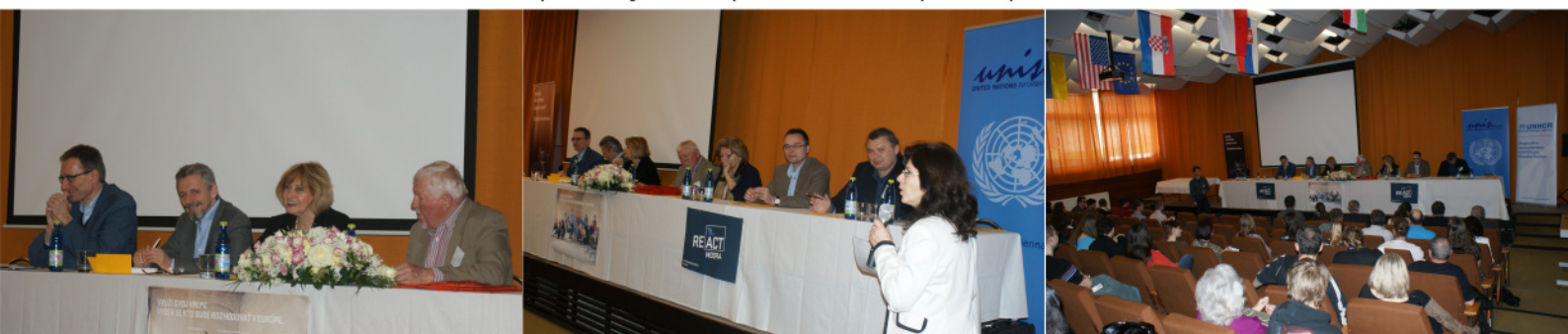
Finálová porota pri práci a v závere súťaže