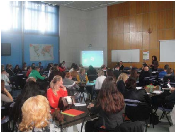
Predsedníčka CK OLP D. Horná a publikum podujatia v Prešove.